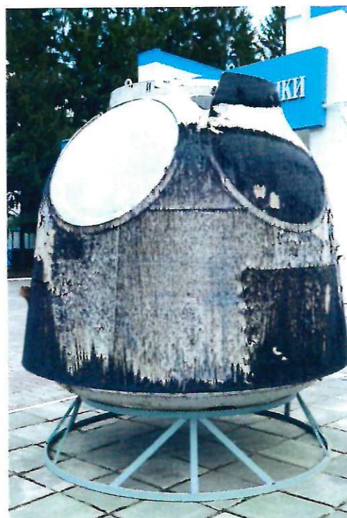
Спускаемый аппарат космического корабля «СОЮЗ ТМА -1», в котором члены 6-ой долговременной экспедиции на МКС приземлились 4 мая 2003 г.