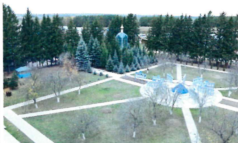
«Фруктовый сад, заложенный в 1962 году в честь полета А.Г. Николаева на космическом корабле «Восток-3».