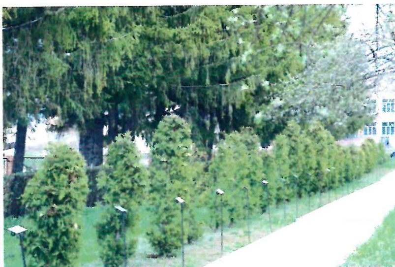
Аллея почетных гостей (70 туй) (2008 г.).