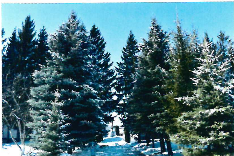
Аллея космонавтов (67 елей и 3 кедра) (2001 г.).