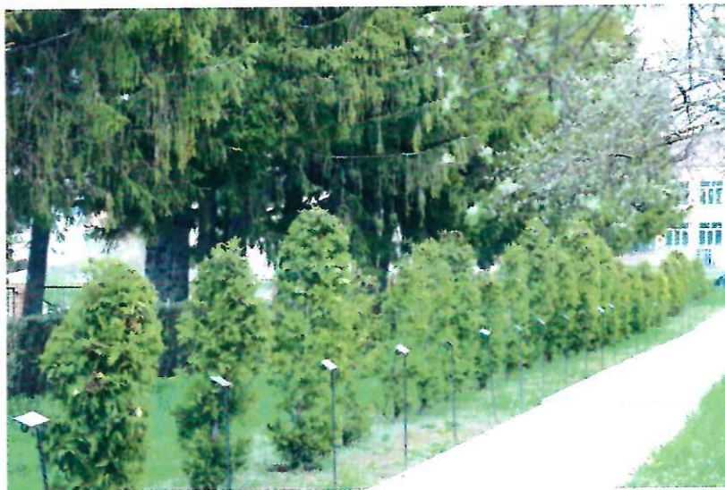
Аллея почетных гостей – туи.