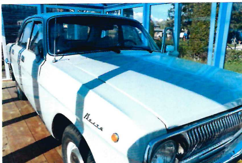
Автомобиль ГАЗ 24-10 «Волга», принадлежащий А.Г.Николаеву.

- спускаемый аппарат космического корабля «СОЮЗ ТМА -1», в котором члены 6-ой долговременной экспедиции на МКС приземлились 4 мая 2003 г.