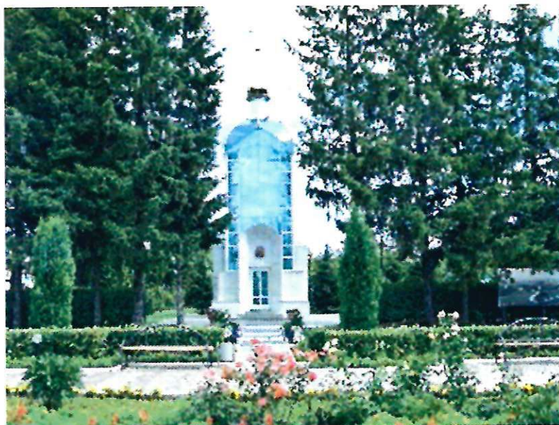
Православная часовня-усыпальница над могилой А.Г. Николаева (2005 г.).