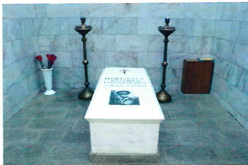
Могила дважды Героя Советского Союза, летчика-космонавта СССР Андриана Григорьевича Николаева (2004 г.).