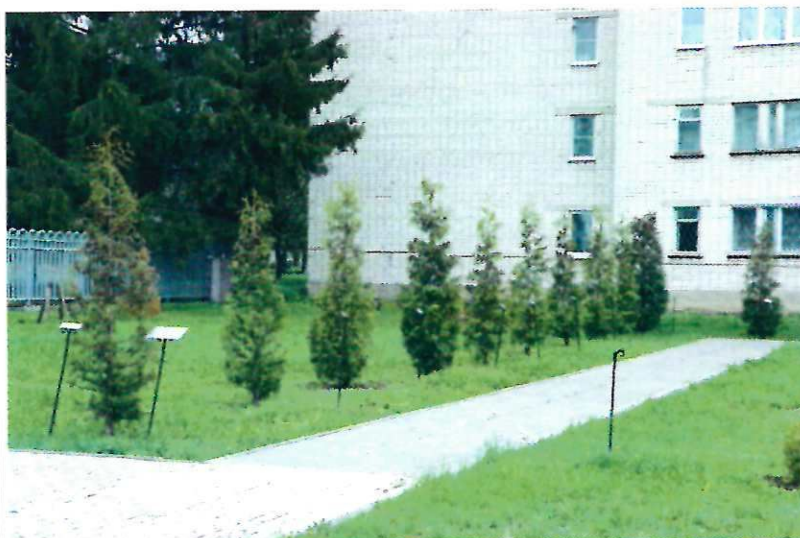
Аллея землячеств (29 туй) (2015 г.).