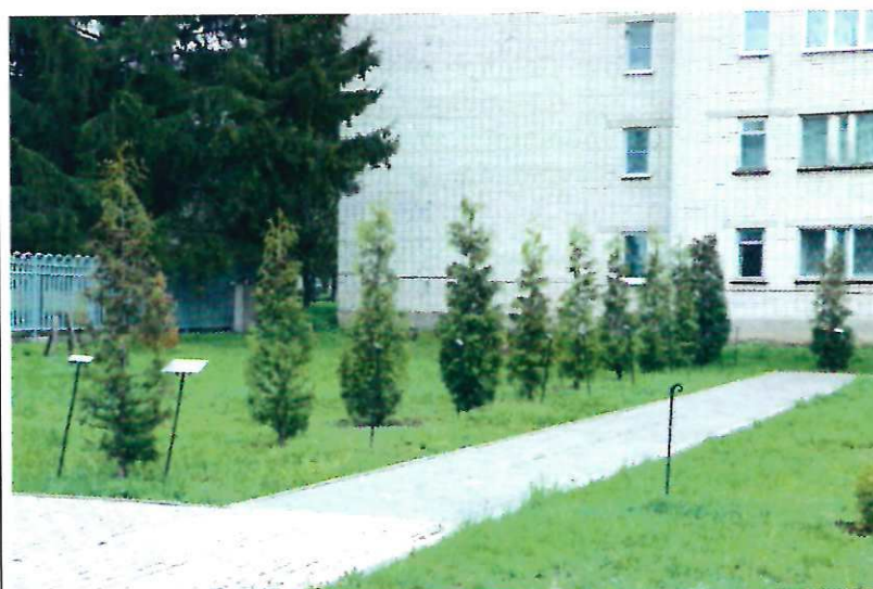
Аллея землячеств – туи.