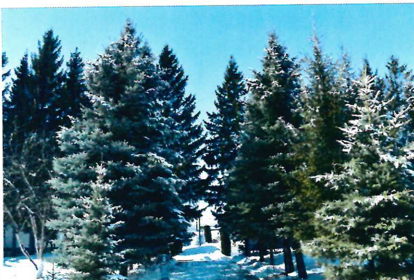
Аллея космонавтов – ели и кедры.