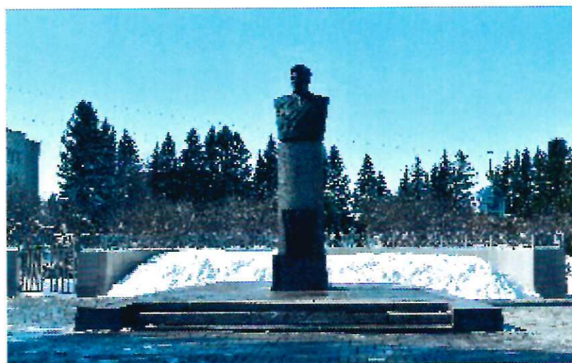
«Бюст дважды Героя Советского Союза, летчика- космонавта СССР Андрея Григорьевича Николаева»