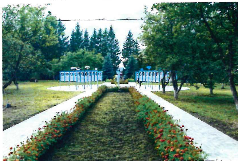
Фруктовый сад – плодовые деревья.