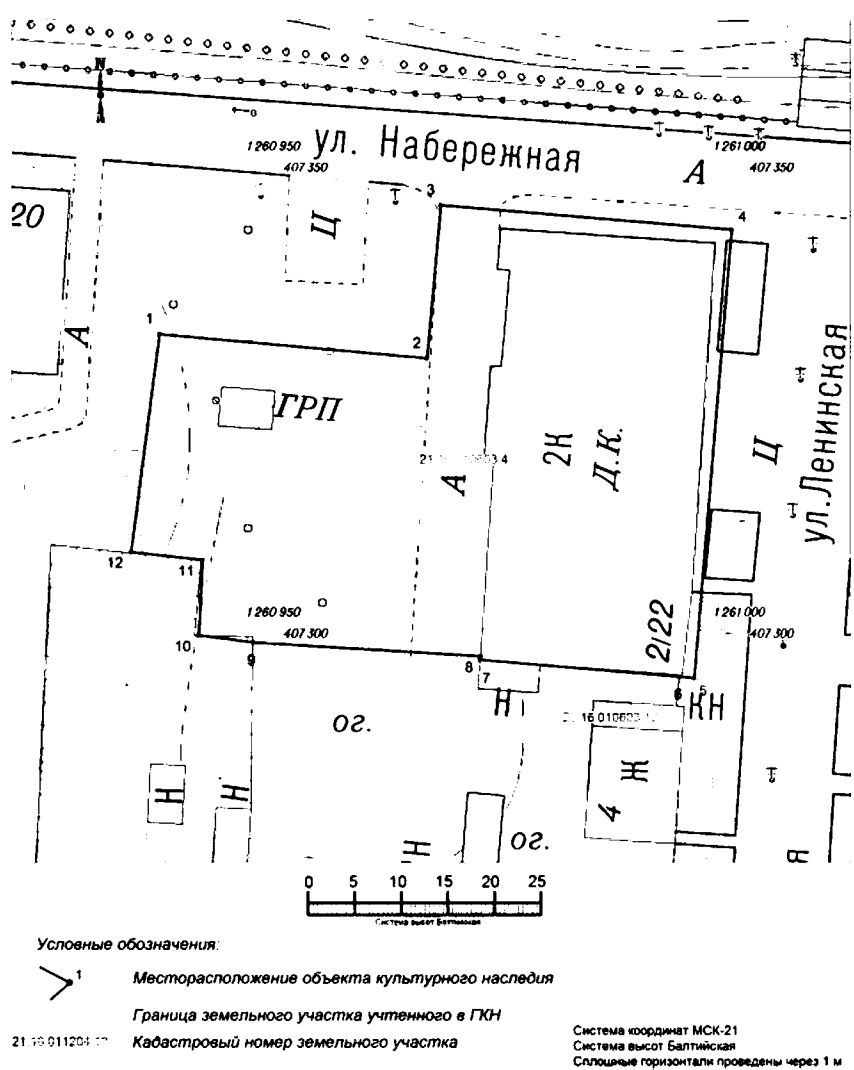
Схема границ территории объекта культурного наследия (памятника истории и культуры) регионального (республиканского) значения «Каменный двухэтажный дом, II пол. XIX в.», расположенного по адресу: Чувашская Республика, Мариинско-Посадский район, г. Мариинский Посад, ул. Набережная, д. 22 (далее - объект культурного наследия):