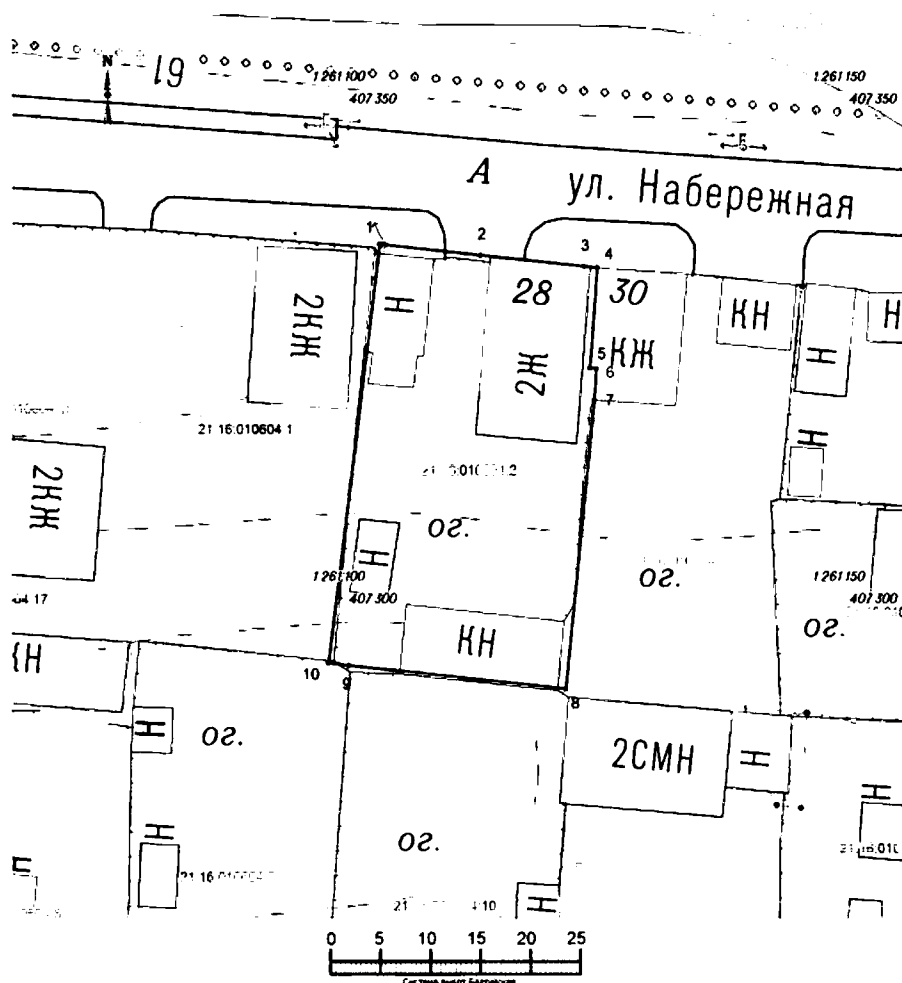
Схема границ территории объекта культурного наследия (памятника истории и культуры) регионального (республиканского) значения «Административное здание, начало XX в.», расположенного по адресу: Чувашская Республика, Мариинско-Посадский район, г. Мариинский Посад, ул. Набережная, д. 28 (далее - объект культурного наследия):