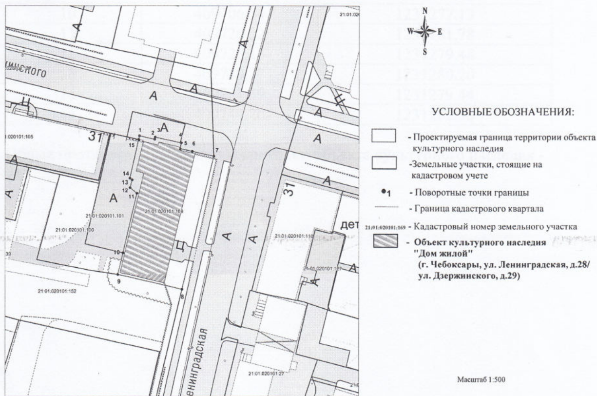
Схема границ территории объекта культурного наследия (основной чертеж)

1. Схема границ территории объекта культурного наследия регионального (республиканского) значения «Дом жилой, 1930-е годы», расположенного по адресу: Чувашская Республика, г. Чебоксары, улица Ленинградская, д. 28/29 (далее - объект культурного наследия):