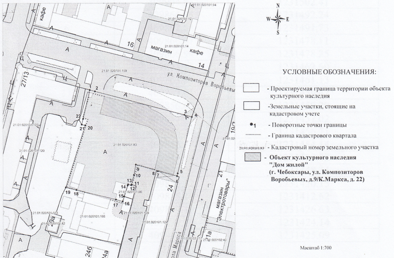
Схема границ территории объекта культурного наследия (основной чертеж)

1. Схема границ территории объекта культурного наследия регионального (республиканского) значения «Дом жилой, 1930-е годы», расположенного по адресу: Чувашская Республика, г. Чебоксары, улица Композиторов Воробьевых, д. 9/22 (далее - объект культурного наследия):