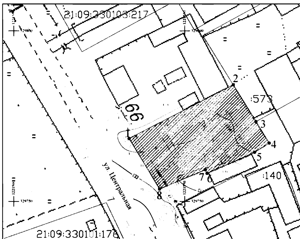
Схема границ территории объекта культурного наследия (памятника истории и культуры) регионального (республиканского) значения «Усадьба народного артиста СССР Максима Дормидонтовича Михайлова (жилой дом, амбар, баня, дровяник, коровник)», дата создания (возникновения) не определена, расположенного по адресу: Чувашская Республика, Вурнарский муниципальный округ, д. Кольцовка, ул. Центральная, д. 68 (далее - объект культурного наследия):

Границы территории объекта культурного наследия (памятника истории и культуры) регионального (республиканского) значения «Усадьба народного артиста СССР Максима Дормидонтовича Михайлова (жилой дом, амбар, баня, дровяник, коровник)», дата создания (возникновения) не определена, расположенного по адресу: Чувашская Республика, Вурнарский муниципальный округ, д. Кольцовка, ул. Центральная, д. 68